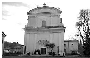
san Gaetano –PASTRENGO sangaetano.ps@gmail.com

Da 28 Dicembre domenica a 04 Gennaio 2026