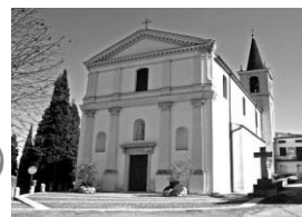
san Zeno -PIOVEZZANO sanzeno.pv@gmail.com

“BEATO CHI TEME IL SIGNORE E CAMMINA NELLE SUE VIE”