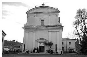
Esal.de.S. Croce- Pastrengo sangaetano.ps@gmail.com