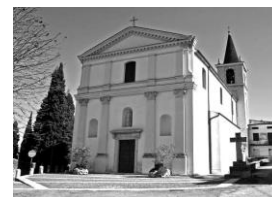
san Zeno -PIOVEZZANO sanzeno.pv@gmail.com